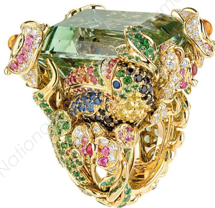
Victoire de Castellane : Collection Dior

La créatrice de bijoux de luxe Victoire de Castellane fait appel à vos talents pour organiser le dîner de lancement de sa nouvelle collection. Elle vous demande de vous inspirer de ses créations pour le dressage à l'assiette, d'un plat végétarien.