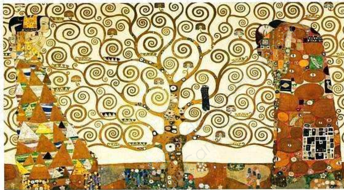
L'arbre de vie (1905-1909), de Gustave Klimt